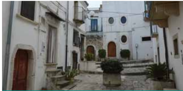
Largo San Filippo Neri

Currere Venusia "Memorial Gino Coppola" VIII Edizione a cura di EssediSport Venosa