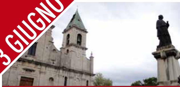
Chiesa San Filippo Neri (Chiesa del Purgatorio)