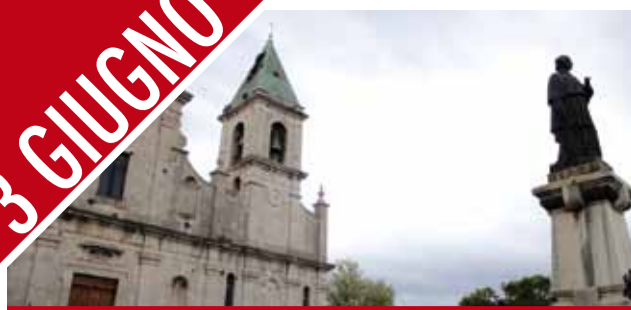
Chiesa San Filippo Neri (Chiesa del Purgatorio)