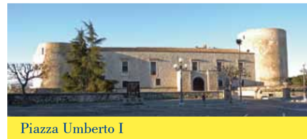
Piazza Umberto I