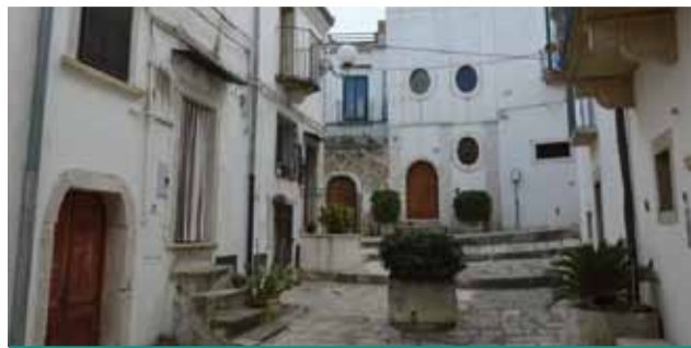
Largo San Filippo Neri

Currere Venusia "Memorial Gino Coppola" VIII Edizione a cura di EssediSport Venosa