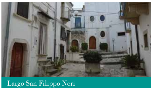
Largo San Filippo Neri