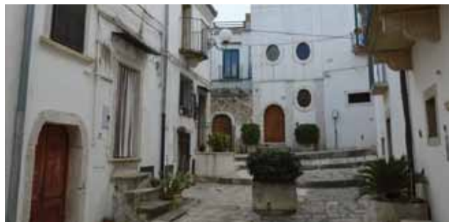
Largo San Filippo Neri

Currere Venusia "Memorial Gino Coppola" VIII Edizione a cura di EssediSport Venosa