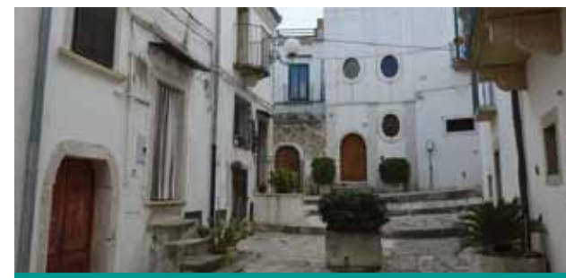
Largo San Filippo Neri

Partenza e arrivo Piazzale antistante Fontana Angioina a partire dalle ore 18,00 I bambini possono salire solo se accompagnati da un adulto.