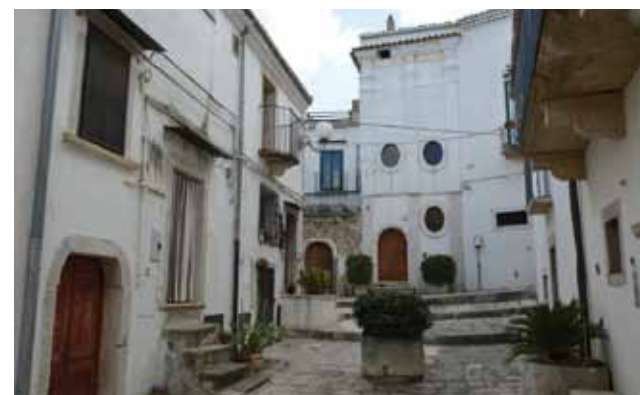
Largo San Filippo Neri