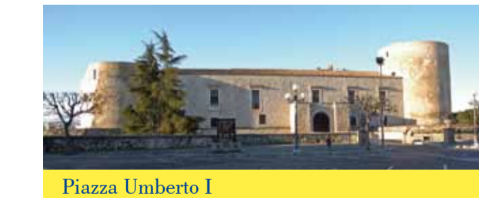
Piazza Umberto I