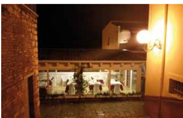
Ristorante l'Incanto (Discesa Capovalle, 1)