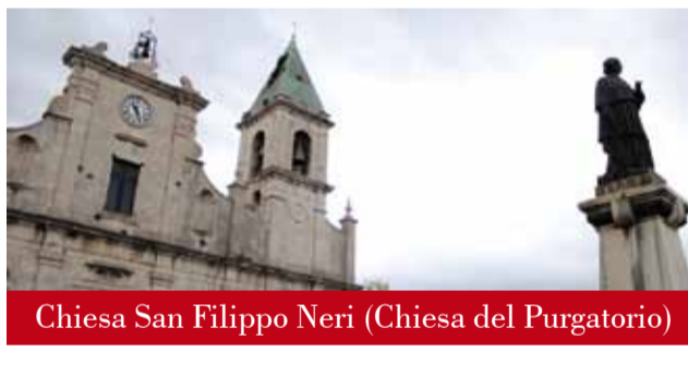
Chiesa San Filippo Neri (Chiesa del Purgatorio)