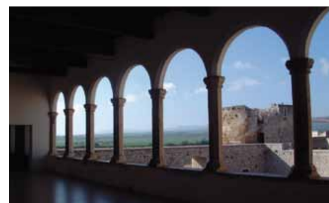
Loggiato del Castello

Mi racconti una storia? Ore 11,00-12,30 Ore 18,00-20,00